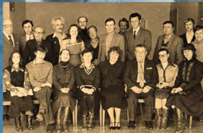
Члены литературного объединения при редакции газеты «Тагильский рабочий». 1980-е годы.