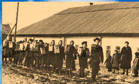
Учащиеся Созиновской семилетней школы Шабалинского района с самодельными скворечниками в День птиц